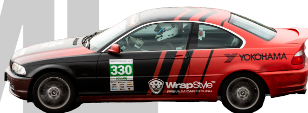
BMW 330ci 2001 - Man 231hk 1447kg = 6,26 R-Däck