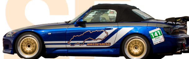
Honda S2000 2001 - Man 241hk 1300kg = 5,39 Gatdäck*