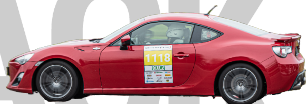
Toyota GT86 2013 - Man 200hk 1260kg = 6,30 Gatdäck el R-Däck*