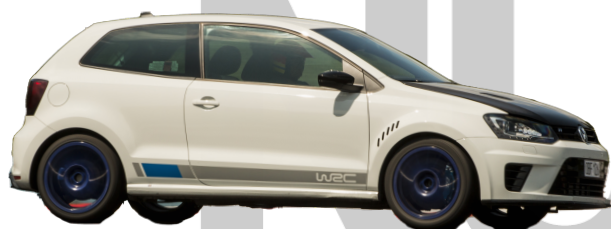
VW Polo WRC 2014 - Man 220hk 1289kg = 5,85 Gatdäck*