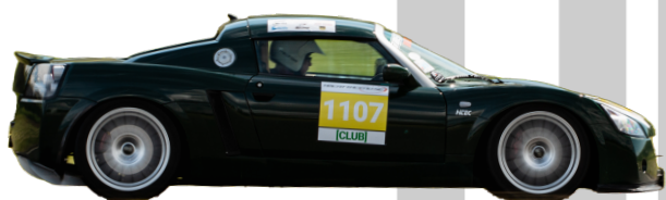
Opel Speedster 2.2 2002 - Man 147hk 940kg = 6,395 R-Däck