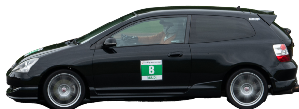
Honda Civic Type R 2005 - Man 200hk 1230kg = 6,15 R-Däck