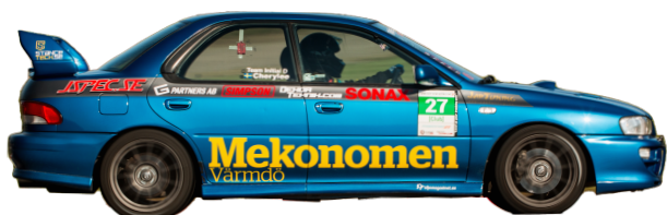
Subaru Impreza GT 1999 - Man 218hk 1230kg = 5,64 Gatdäck*