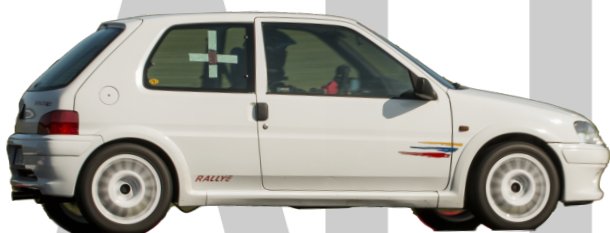
Peugeot 106 Rallye - Man 103hk 800kg = 7,37 R-Däck