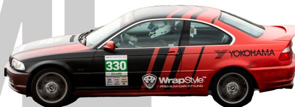
BMW 330ci 2001 - Man 231hk 1447kg = 6,26 R-Däck