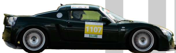
Opel Speedster 2.2 2002 - Man 147hk 940kg = 6,395 R-Däck