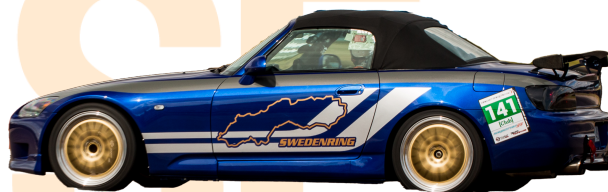
Honda S2000 2001 - Man 241hk 1300kg = 5,39 Gatdäck*