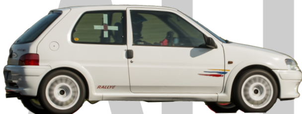
Peugeot 106 Rallye - Man 103hk 800kg = 7,37 R-Däck