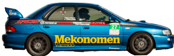
Subaru Impreza GT 1999 - Man 218hk 1230kg = 5,64 Gatdäck*